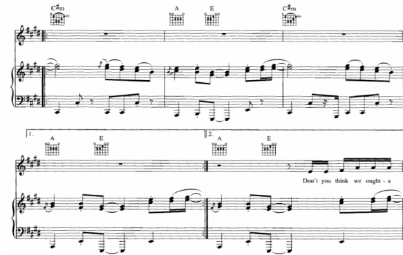
[그림 4] Slow Dancing In A Burning Room의 Guitar Solo 1

Chorus의 5도-4도-6도의 단순한 코드 진행을 16분음표로 나눠서 코드 스트로크를 진행하고 3도와 4도를 계속 섞어주면서 후렴 연주의 긴장감을 유발시켜준다.