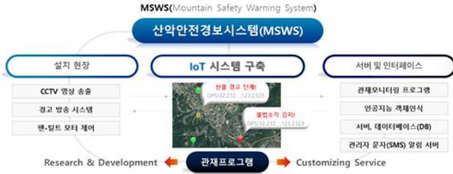
[그림 1] 산악안전경보시스템 개요도

산악안전경보시스템은 산악 지역에서의 산불·불법소각, 산사태 등의 발생을 감시하고 예방하는 목적을 지닌다. 그림 1은 산악안전경보시스템의 개요도를 나타내었고, 그림 2는 시스템 블록도를 나타내었다.